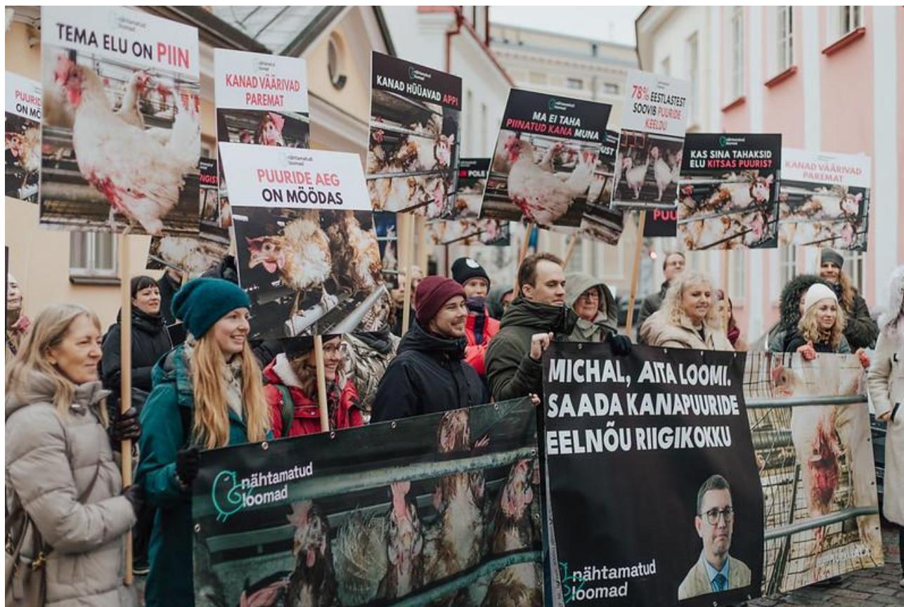
Meeleavaldus Valitsuse ees, et peaminister Kristen Michal saadaks kanapuuride eelnõu edasi Riigikokku.

Kampaania sõnumid jõudsid inimesteni ka tänavapildis: tänu annetajatele tõime kanade kannatused puurides välireklaamide kaudu avalikkuse ette. Need tegevused aitasid hoida teemat ühiskondlikus arutelus ja näidata otsustajatele, et Eesti inimesed ootavad loomasõbralikumat munatootmist.